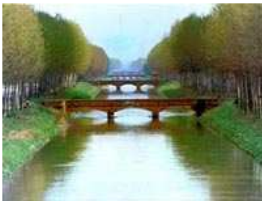
Il Canale Cavour a Biandrate

Per Domenica 7 ottobre gli Amici del Ticino propongono un'escursione in bicicletta dal Sesia al Ticino lungo l'alzaia del Canale Cavour e visita all'Abbazia di San Nazzario e Celso, al Museo dell'attrezzo agricolo L'civel ed alla Palude di Casalbeltrame. Qui di seguito il programma e tutti gli approfondimenti sulla gita.