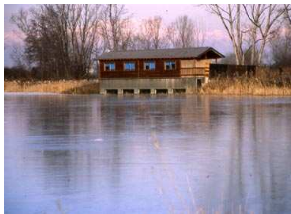
La palude ed il capanno d'osservazione

La Riserva naturale della Palude di Casalbeltrame si estende per 640 ha su un territorio quasi pianeggiante. Nel suo interno sono state individuate due aree: una fascia coltivata di territorio circostante e adiacente classificata "riserva naturale orientata" e l'oasi vera e propria costituita da un'area umida (riserva naturale speciale) dove svernano e nidificano numerose più di 100 specie di fauna avicola. Dal 10 luglio 1990 l'intera area è di proprietà regionale e viene gestita dall'Ente Parco Lame del Sesia che ha recuperato e ripristinato la palude e creato una serie di strutture per le attività didattiche e di osservazione naturalistica. In particolare sono stati costruiti un osservatorio su due piani che permette l'osservazione sia da un punto sopraelevato sia da un punto sotto il livello dell'acqua ed un'area attrezzata.