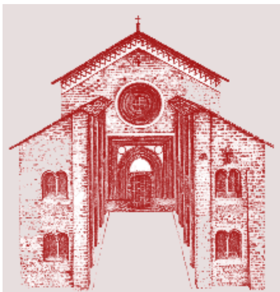
La facciata dell'abbazia di San Nazzaro

chostro, impreziosito dal ciclo di affreschi tardo quattrocenteschi rappresentante episodi della vita di San Benedetto.